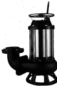
Série DS / DSK